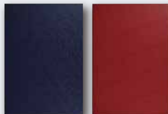
沈香セット用紙箱