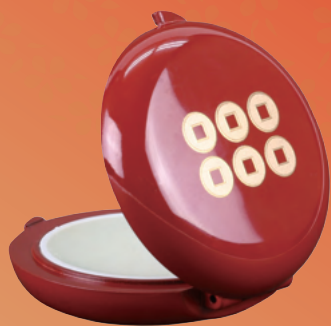
❖ ぬり香 3,000円

「日本一の兵」 つわもの とも謳われた戦国武将 真田信繁(幸村)の 香りをイメージして香木(白檀)を ベースとして誕生しました。