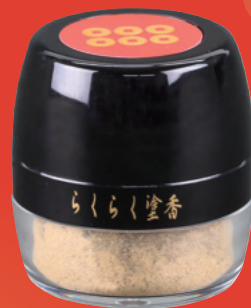
❖ らくらく塗香 1,500円

手首や首筋にぬる“真田のかほり”のねり香水。 香合(容器)には、山中塗に六文銭の蒔絵を施 しました。