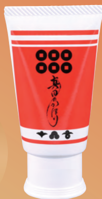
❖ お香ハンドクリーム 1,000円

武将のたしなみとして、 ふところ 懐などに しのばせていた香り袋(匂い袋)です。